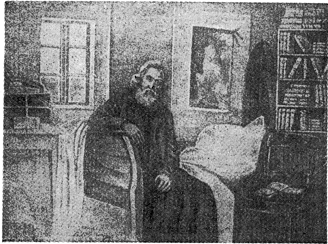
ריב"ל אויפן קראַנקנבעט